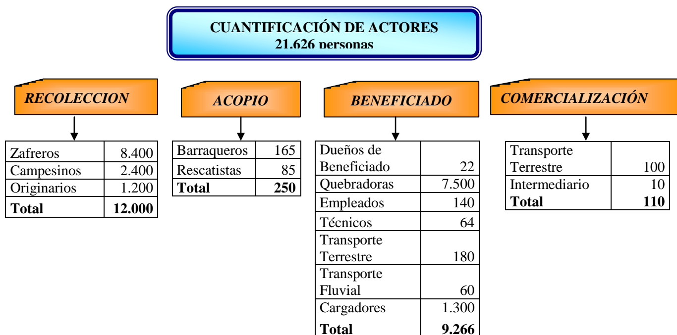
Grafico N° 4