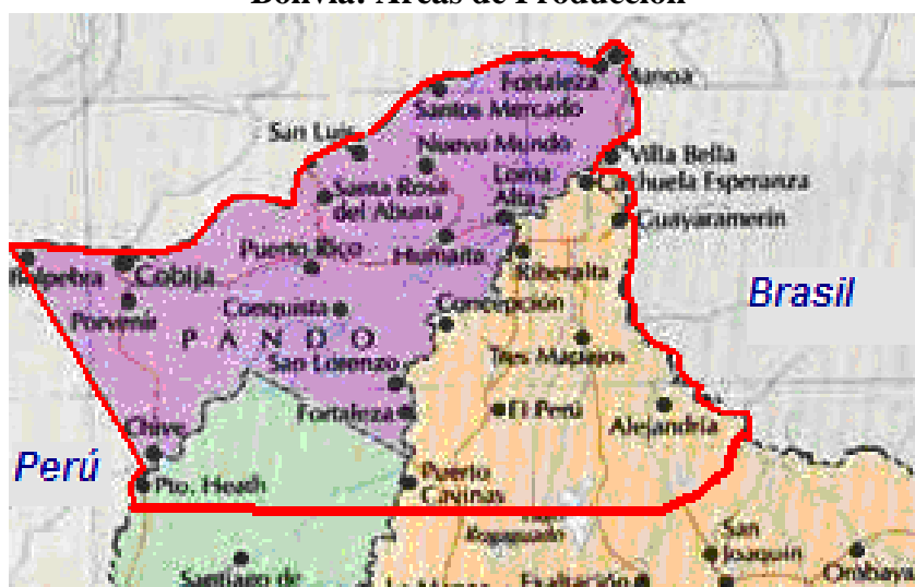
Grafico N° 1 Bolivia: Áreas de Producción